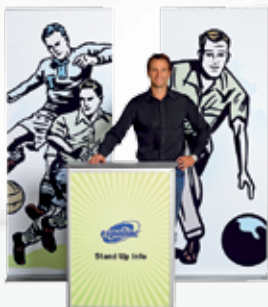
Kombination #2 Roll Up Classic + Stand Up