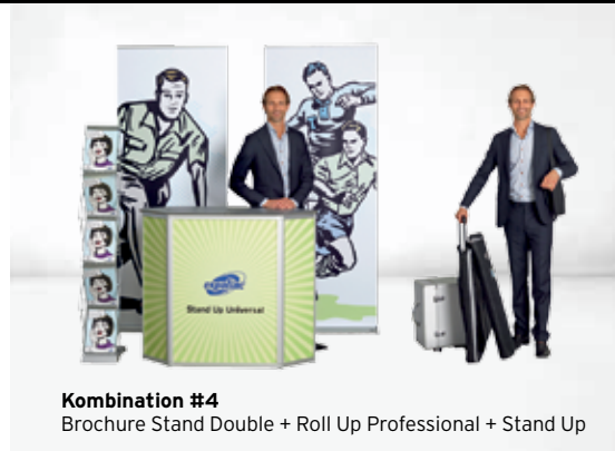
Kombination #4 Brochure Stand Double + Roll Up Professional + Stand Up