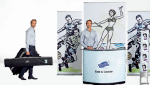
Kombination #5 Roll Up Classic + Case & Counter + Brochure Stand