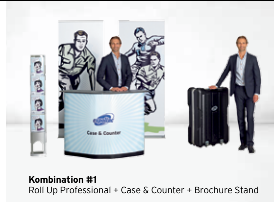
Kombination #1 Roll Up Professional + Case & Counter + Brochure Stand