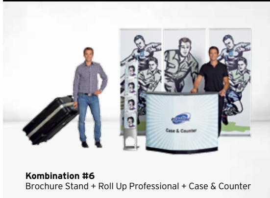
Kombination #6 Brochure Stand + Roll Up Professional + Case & Counter