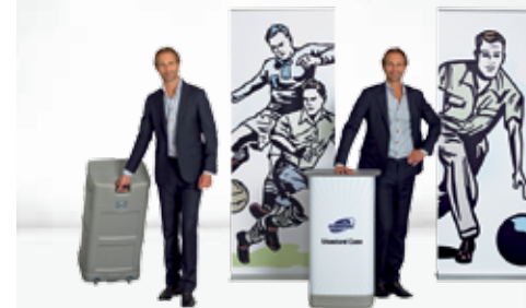
Kombination #3 Roll Up Classic + Standard Case